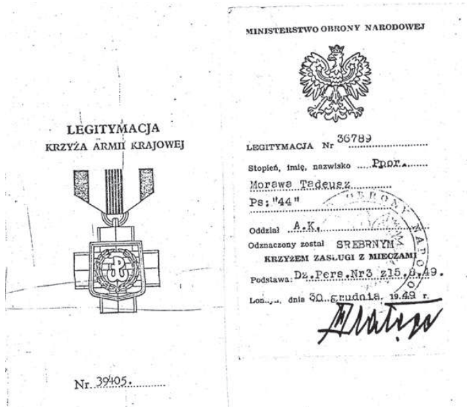
Legitymacja Krzyża Armii Krajowej i Odnaczenie Srebrnym Krzyżem Zasługi z Mieczami oraz Medalu Wojska